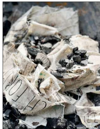
Die Affirmations-Bänder in der Asche

Die Installation und Eröffnung findet bei jeder Witterung statt. Am Samstag, 11. November gibt es von 14.00 bis 15.30 Uhr eine Vernissage mit Apéro und Musik. Am Sonntag, 12. November kann die Installation bis 17 Uhr besichtigt werden. Die Künstlerin wird an beiden Tagen von 14 bis 16 Uhr vor Ort sein. Zusätzlich sind Informationsflyer beim Jagdhaus vorhanden. Infos unter Tel: 079 257 40 63 oder info@stellart.ch