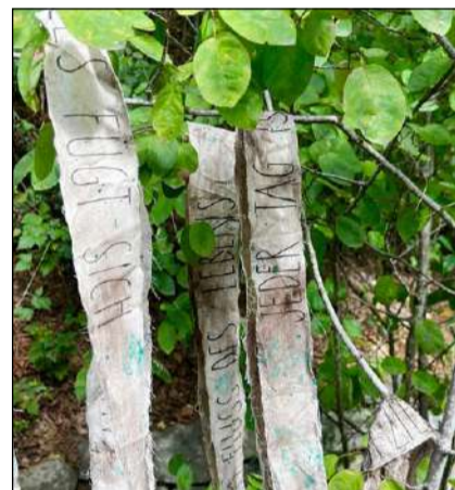
Der Wind blies durch die Bänder.