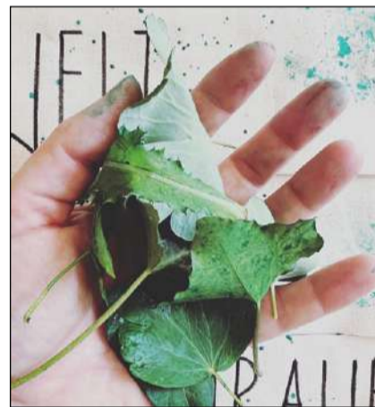
Drucke mit Pflanzen aus dem Garten

Gewerbeverein Reusstal besichtigte wirtschaftlich unabhängiges Mehrfamilienhaus