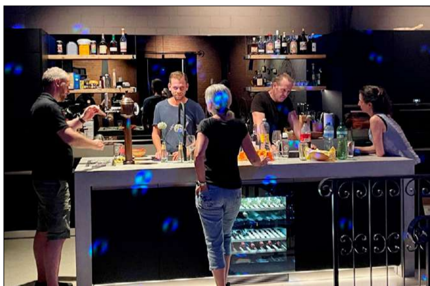
Idealer Rahmen für Gespräche: Mach-Bar.

Der Vorstand freute sich an diesem Abend über gleich zwei Premieren: Das neue Werbematerial des Gewerbevereins sowie die ersten gedruckten Visitenkarten mit dem neuen Logo wurden präsentiert. Beim nächsten Anlass folgen dann die einheitlichen Vorstands-T-Shirts. Zudem freute sich der Präsident darüber, dass auf die Einladung zur zweiten Reusstal-Gewerbe-Ausstellung-Tischmesse 2025 in Tägerig, die an die Mitglieder versandt wurde, schon etliche Anmeldungen eingegangen sind. Er freute sich auch darüber, dass am Vorabend an der Einwohnergemeindeversammlung in Niederwil, die Unterzeichnung der